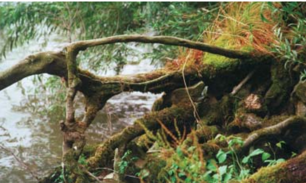
Unberührte Aulandschaft soll Donaubrücke und Strassen weichen

dass vor dem Bau einer Donaubrücke Korneuburg - Klosterneuburg eine Klosterneuburger Volksbefragung durchzuführen ist. Der Gemeinderat hat darauf mit den Stimmen aller Parteien eine derartige Volksbefragung beschlossen. Der Zeitpunkt der Befragung wird nach dem genauen Festle-