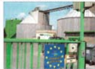
Kläranlage Klosterneuburg: Bestbieter aus Deutschland

„Mülltourismus“ - Schwanitz kritisiert die Vergabe durch die Grünen der Bundesregierung.